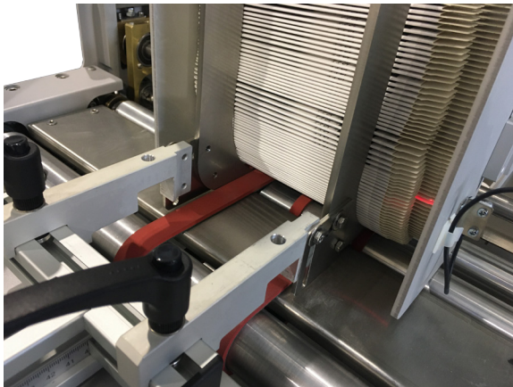
Magazin für schmale Produkte wie Lippenstift oder Eye-Liner